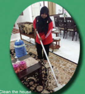
Clean the house